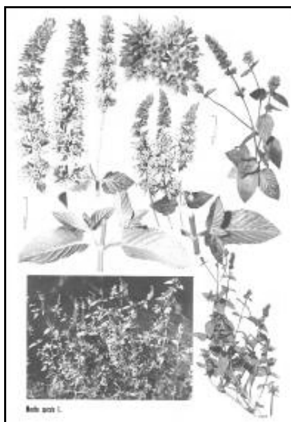
شکل ۱. نعنا دشتی (۱۲).

نام علمی: Mentha spicata L. (شکل ۱) Syn.: M. viridis L.