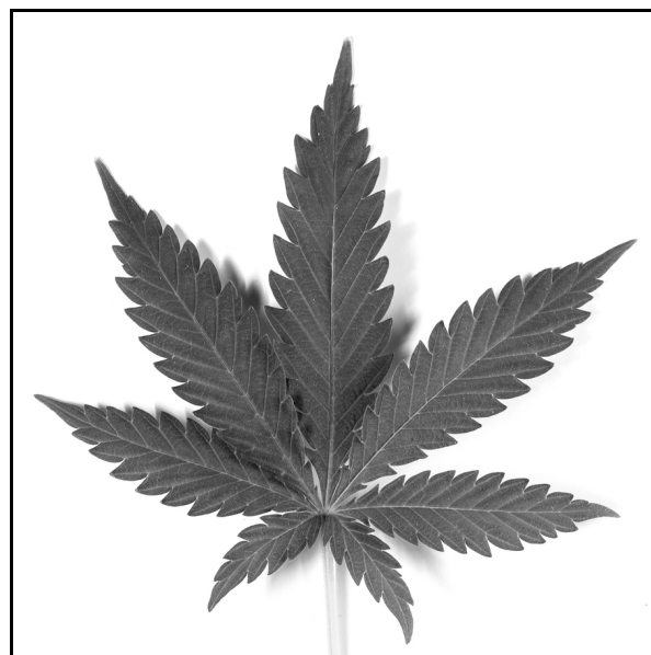
شکل ۱. برگ گیاه Cannabis sativa L.

گیاهان بلندی می‌شود که فعالیت فارماکولوژیکی کمی دارند، در حالی که در مورد دَوَم تمایل نسبت به گیاهان کوتاه و انبوه بیشتر است (۲۴-۲۰،۲۲).