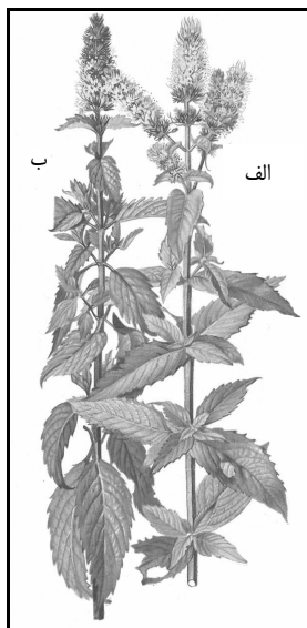
شکل ۳. تصاویر پونه (الف) و نعنا فلفلی (ب) (۱۶).

نام علمی: Mentha longifolia (L.) Hudson (شکل ۳ الف) Syn.: M. spicata L. var. longifolia L., M. sylvestris L.