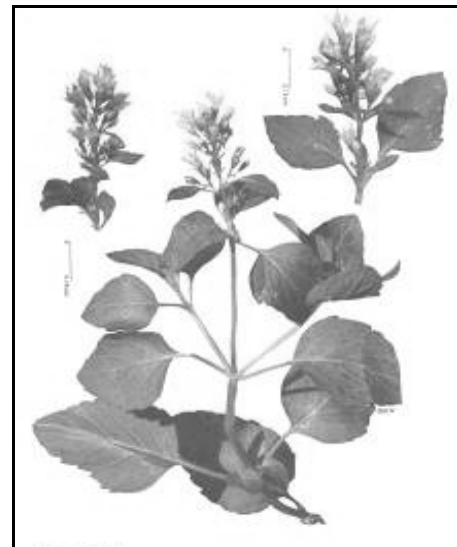
شکل ۴. تصویر نعناى جویباری (۱۲).