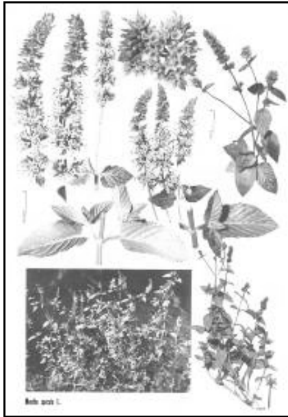
شکل ۱. نعنا دشتی (۱۲).

نام علمی: Mentha spicata L. (شکل ۱) Syn.: M. viridis L.