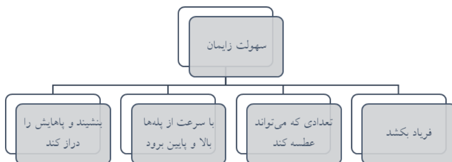
شکل ۲. تدابیر سهولت زایمان از دیدگاه طبری

نوزاد پیش آید، بهتر است زنی برای شیردادن به نوزاد انتخاب شود که سن او بین ۲۵ تا ۴۰ سال باشد، بدنی سالم داشته، مزاج و ظاهر و اندازه پستان‌های او متوسط بوده، کمی از زمان زایمان او گذشته باشد و صاحب فرزند پسر باشد (۱۱). مطالعات امروز نشان داده است که مادران دارای نوزادان پسر شیری تولید می‌کنند که ۲۵ درصد انرژی بیشتری نسبت به مادران دارای نوزادان دختر دارد (۱۲).