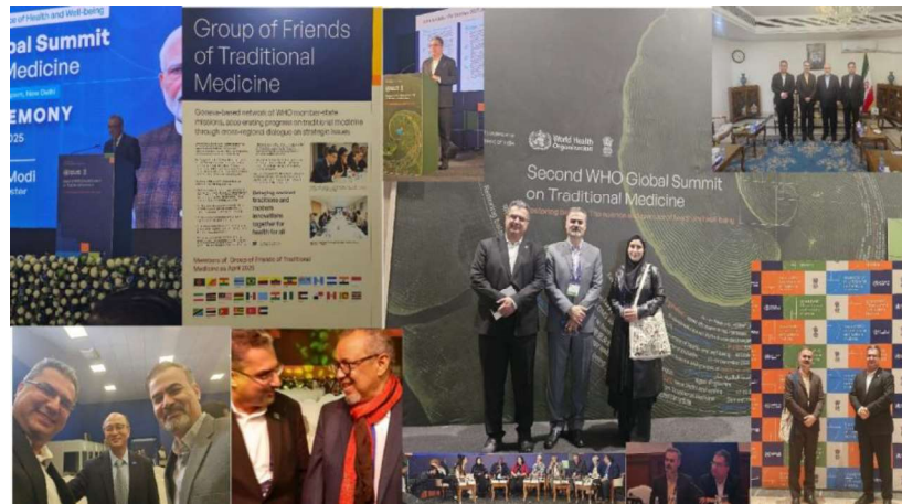
تصویر ۱. حضور نمایندگان ایران در دومین اجلاس طب سنتی سازمان جهانی بهداشت در دهلی

- تدوین پنج دستورالعمل بالینی برای اقدامات بالینی طب ایرانی؛ - ادغام خدمات طب سنتی در نظام سلامت کشور. این تعهدات که با حضور مقامات بلندپایه سازمان جهانی بهداشت و کشورهای مختلف دنیا رونمایی شد، گام مهمی برای کشور در تثبیت موقعیت منطقه‌ای و جهانی خود در موضوع طب سنتی، به‌عنوان کشوری با قابلیت مرجعیت، تثبیت طب ایرانی به‌عنوان یک مدل طب سنتی توانمند با خواستگاه تمدنی ایران و همچنین توسعه همکاری‌های کشور با سازمان جهانی بهداشت می‌باشد.