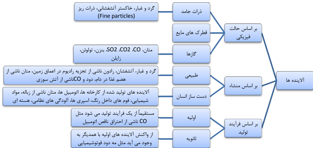
شکل ۲: تقسیم بندی آلاینده ها در دانش امروزی (۳۲)