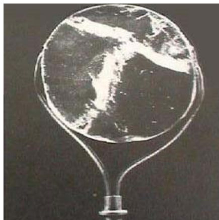
تصویر ۴: عدسی از دوره اشکانیان

ترجمه متن : سلامی روایت می کند از لحام که ابوبشر سیرافی گوید : شبی در نزد دایی خویش در سراندیب (سیلان یا سری لانکا) بودم ، او نگیی از جنس یاقوت سرخ حاضر کرد و آن را بر روی حروف کتاب قرار می داد تا آن را بخواند - راوی از این کار در شگفت شد و سئوالی برایش مطرح گردید ، چگونه ممکن است در تاریکی آنهم بدون تابیدن نور ، خواندن در سیاهی شب ممکن گردد . آن یاقوت نیمکره ای شکل بود که سطح صاف آن روی کتاب نهاده می شد . استاد ابوریحان به نکته ای ارزشمند اشاره می کند : (یاقوت نیز همچون بلور می تواند به خواندن دقیق کلمات کمک نماید به شرطی که به شکل نیمکره باشد) . البته در آن مقطع زمانی می دانستند یخ نیز چنین ویژه گی را دارا می باشد ، مسلماً این خصوصیات را در شیشه هم می توانستند ، جستجو نمایند ، زیرامی دانستند به کمک محیط شفاف همچون یاقوت محدب مسطح ، نوشته پر رنگتر و سطور درشت تر دیده می شود و از همه جالبتر ، ابوریحان تجزیه تحلیل این موضوع را موکول به فن مناظر مینماید ، زیرا در تقسیمات علوم ، علم مناظر وجود داشته و حکمایی بودند که با این علم آشنایی داشتند که میتوان به فارابی و ابن هیثم اشاره نمود . دانشمندان زمان همچون ابن سینا و ابوریحان به موضوع دیدن و دیده شدن و قدرت درشتنمایی محیط های شفاف محدب مسطح اشراف داشتند و هنر مندان دوران توانایی تراش یاقوت و یا بلور را بصورت نیمکره نیز داشته اند و ذره بین کروی یا نیمکره ای شکل از