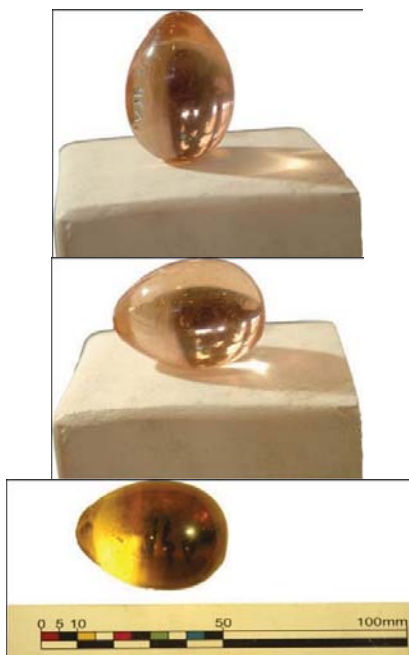
تصویر ۳: ذره بین هزاره قبل از میلاد (موزه تبریز)

شفاف می گردد. مسلماً خاصیت ذره بینی آن شناخته شده بود و نامی هم در این ارتباط داشته است. (تصویر-۳) ذره بینی است محدب الطرفین به طول ۴cm، تخم مرغی شکل از جنس شیشه لیمویی رنگ محل کشف مشکین شهر، سال کشف ۱۳۴۲، قدمت هزاره اول قبل از میلاد (شماره ثبت موزه آذربایجان ۹۴۸) ۲۱.