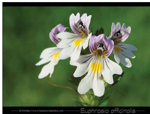
تصویر ۱: گل عینک Euphrasia officinalis

استفاده از گیاهان دارویی برای رفع خطاهای انکساری چشم : تلاش وجستجوی بشر پایانی ندارد . گل عینک از جمله گیاهان دارویی است که جوشانده آن برای رفع ناراحتی های چشم در اثر نوشتن زیاد یا در اثر بادهای شدید ، ضعف دید چشم و ورم ملتحمه مصرف می شود . یعنی در حقیقت کار عینک را انجام می دهد ، با این تفاوت