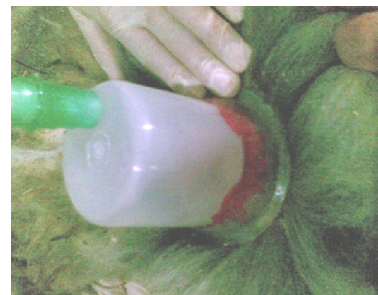
شکل شماره ۱- نحوه اصلاح کردن ناحیه مورد نظر و انجام حجامت در گوسفندان

سنجش گلبول سفید، لنفوسیت و گرانولوسیت، گلبول قرمز، هموگلوبین، MCV، MCH، MCHC و پلاکت به لوله‌های آزمایش استریل حاوی ماده ضد انعقاد EDTA و ۷ میلی لیتر