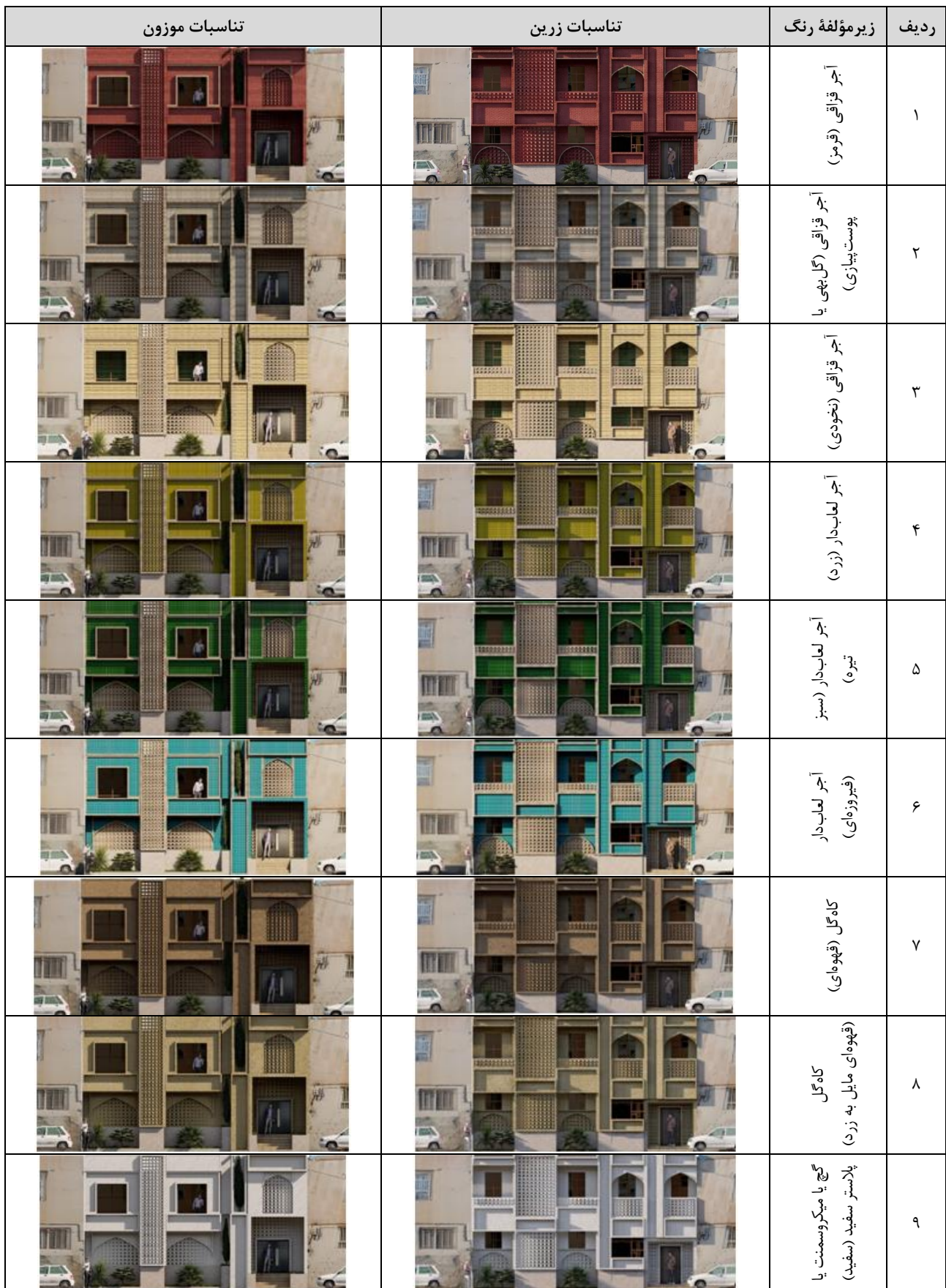
جدول ۱. نماهای طراحی شده براساس رنگ‌های متفاوت (مأخذ: نگارندگان)