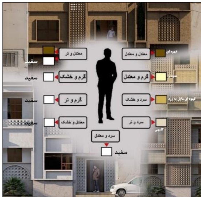
شکل ۴. جمع بندی انتخاب افراد